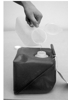
(B) Después de haber orinado, vierta la orina del sombrero u orinal en el recipiente.