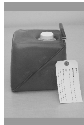
Recipiente para la muestra