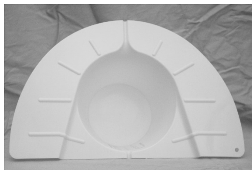
Inserto de inodoro (sombrero)

Por favor siga las instrucciones al reverso de esta página.